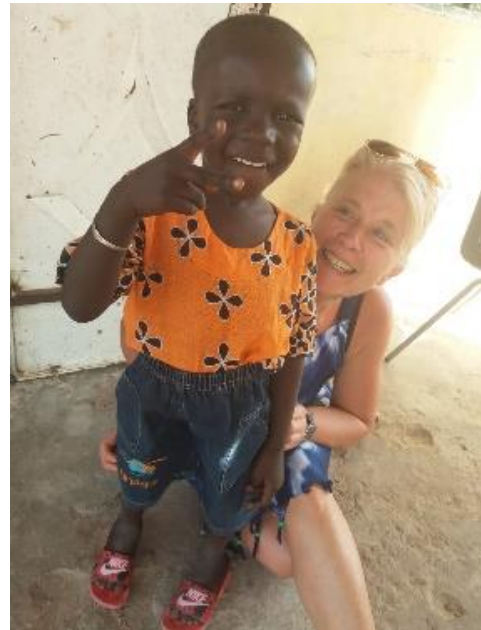
Yaya 4 maanden na de operatie